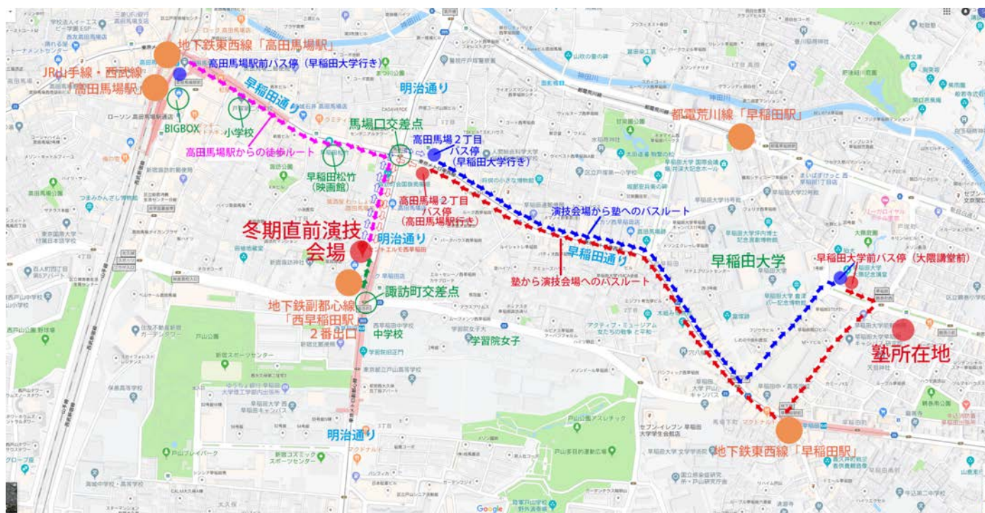
【日芸受験.COM 近くの「西早稲田ダンススタジオ "in the house"」スタジオまでの地図】